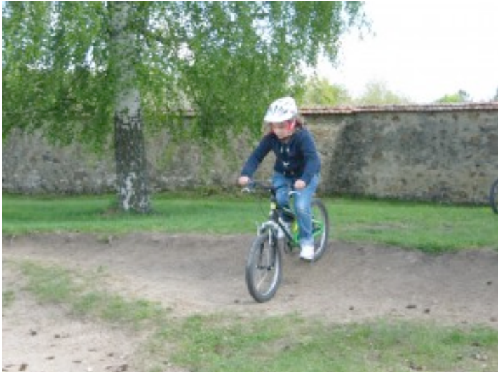
Descente en pente raide