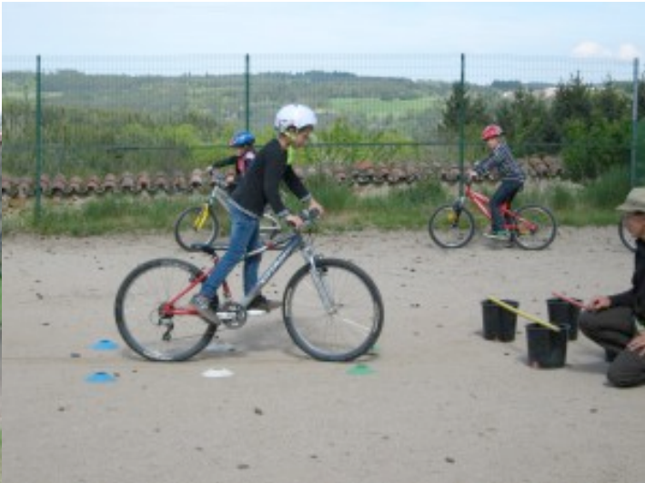
Exercice de freinage précis