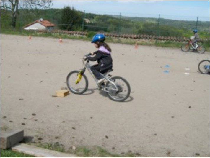
Franchissement d'un obstacle