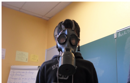
Un masque à gaz de la guerre 1914-18

Ils nous ont apporté des objets de la guerre : un masque à gaz et deux grands livres.