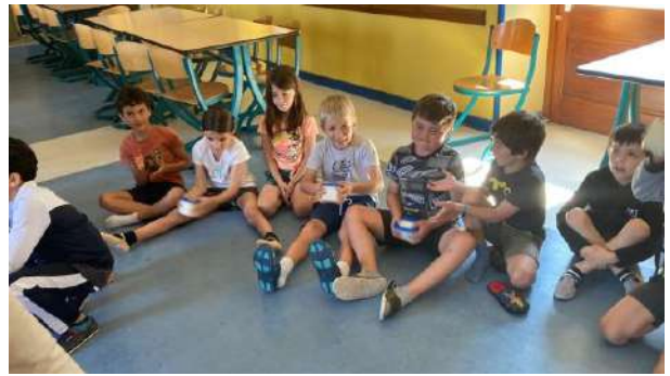
Les CE1B sont partis à la ferme.