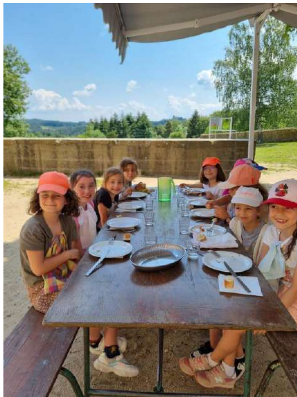
Après le repas pour le CE1 A , départ à la ferme.