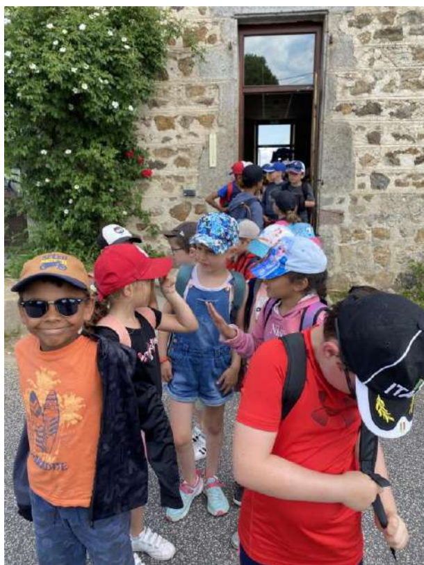
Après une petite marche, sous un soleil de plomb, nous voilà arrivés à la .....? Petit goûter pour recharger les batteries.