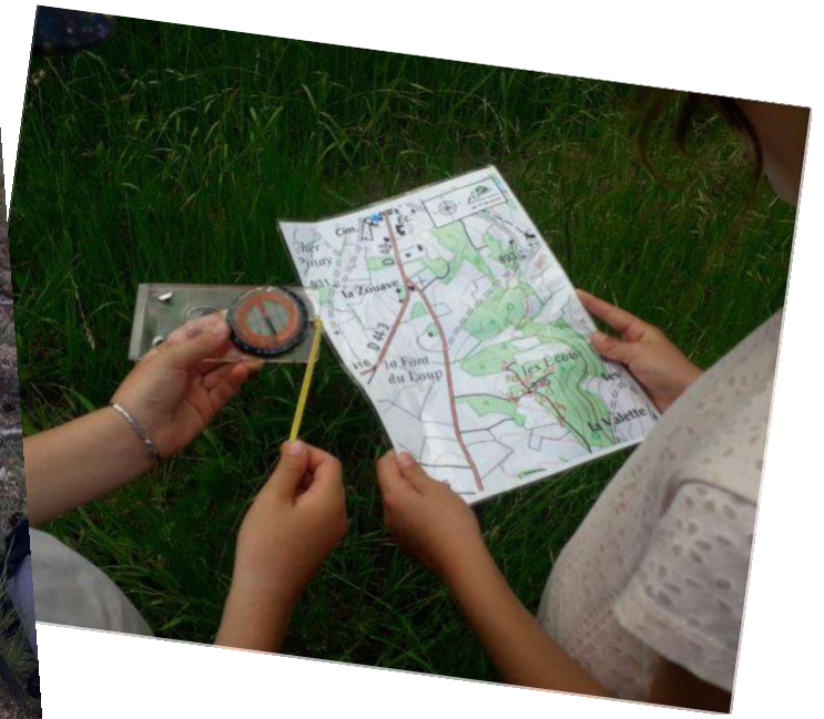
Retour à Apinac après l'activité.